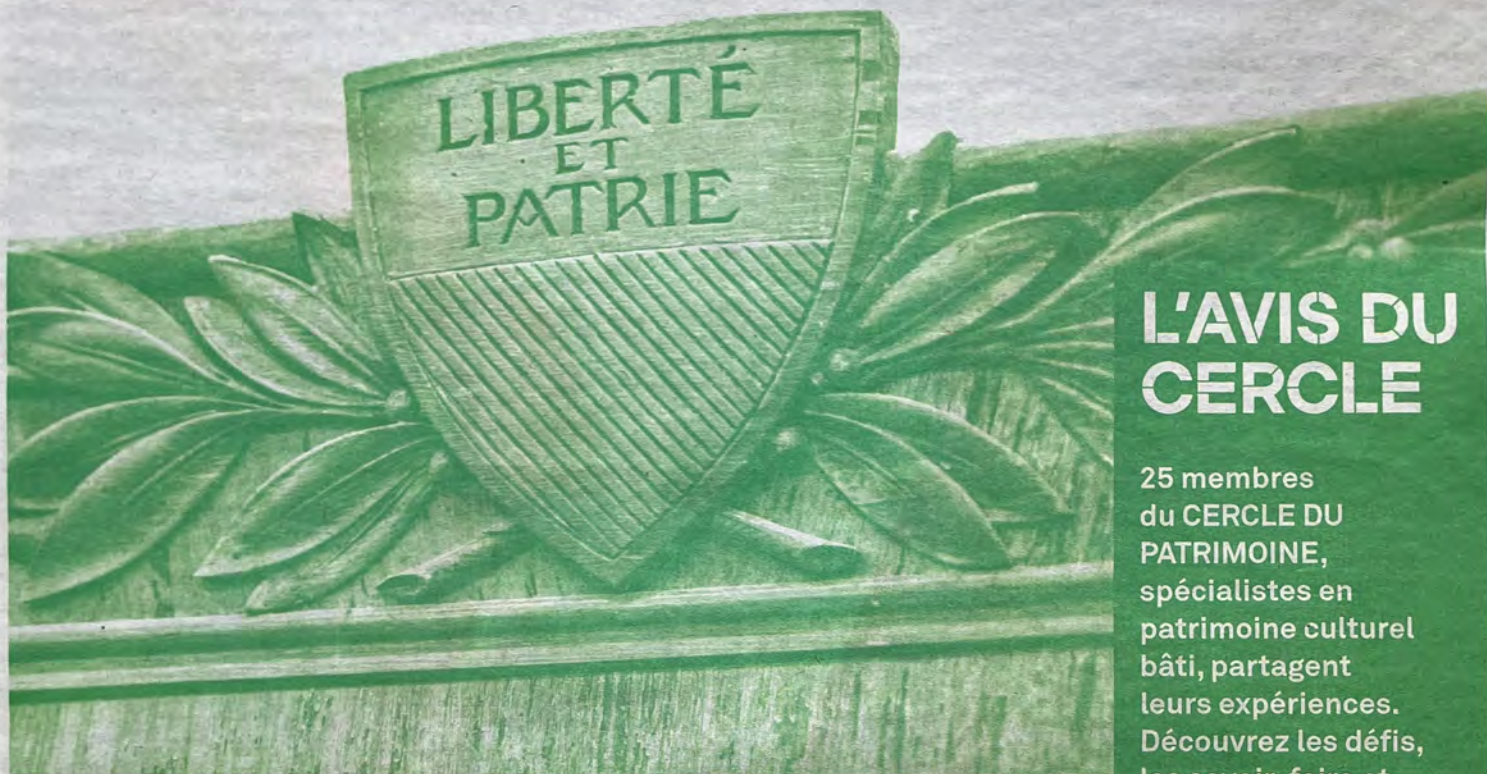
Vitrine en palissandre du Cercle démocratique de Lausanne, récupérée par l'entreprise de Stéphane lors de travaux de transformation. → PAGE 13