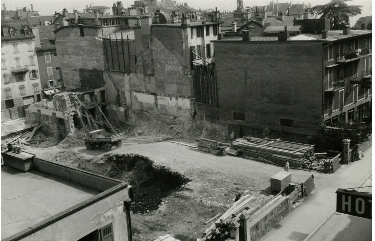
Fig. 1 Le bâtiment de l'avenue Paul-Cérésolle 6 vu du Nord et les parcelles 822, 823 et 825 après démolition du tissu bâti ancien

Mh Vevey Fedia Muller Lausanne Inférieur 2